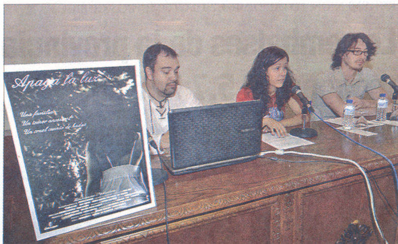
La directora y el jefe de comunicación del cortometraje en la rueda de prensa