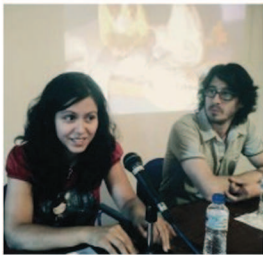
Hemocianina estrena su último cortometraje

La cinta, que cuenta con la colaboración de la Junta de Comunidades de Castilla-La Mancha y el Instituto de la Juventud, se exhibirá el próximo viernes 15 de julio en la sala 12 del Museo López Villaseñor (primera planta), a las 21.00 horas.