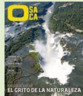
EL GRITO DE LA NATURALEZA

Además, Marta Robles nos habla de Madrid y conocemos los 'gin tonic' más de moda